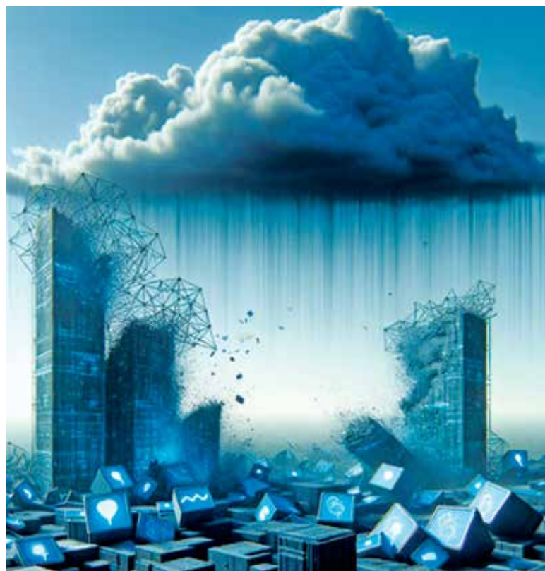
Рисунок 1. От «кибернетики» к «фрактальной эволюции систем — генезису цифры»

В новом подходе сложность рассматривается как естественное свойство системы и управляющие воздействия «живут» в этой сложности