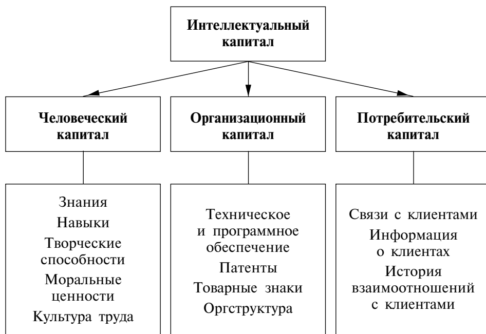
Рисунок 11. Структура интеллектуального капитала