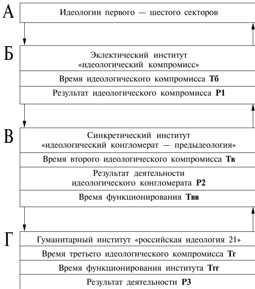
Схема 16. Динамика идеологической институционализации

Для стадий В и Г время компромисса ( T_{в} , T_{г} ) может быть меньше времени функционирования идеологического института ( T_{вв} , T_{гг} ).