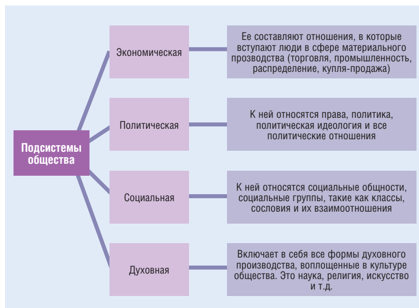
Подсистемы общества и их функции